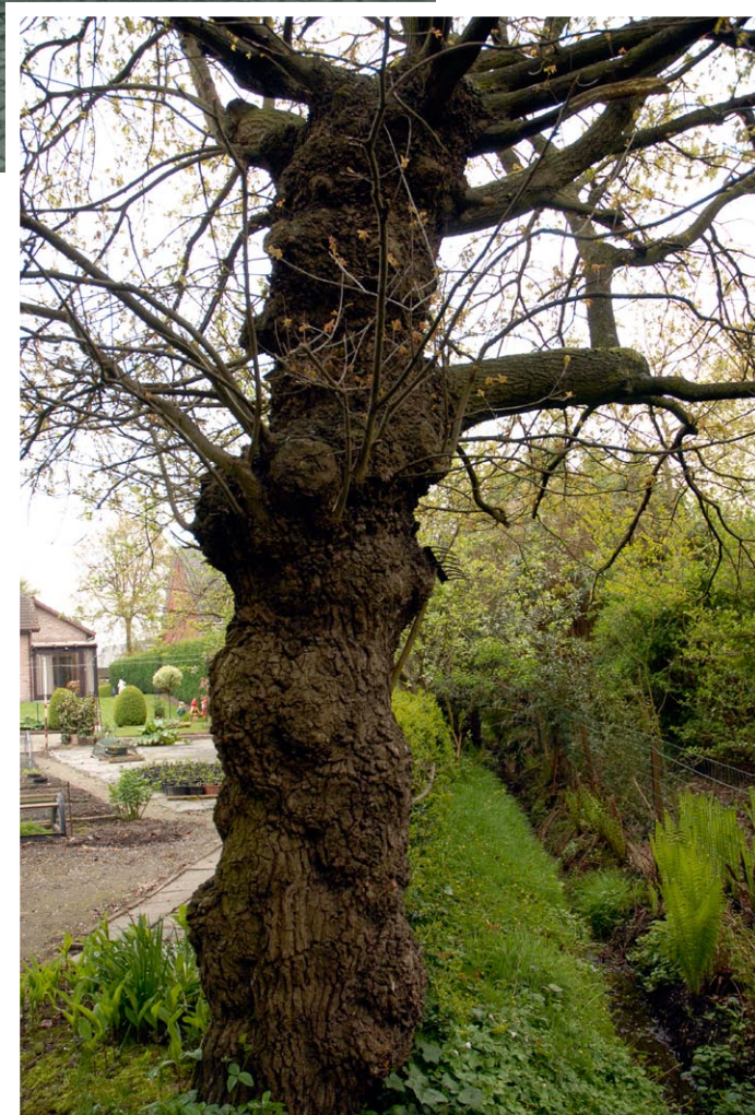
Knoteik in de Halfstraat

We gingen nog op zoek naar een nog "levende" knoteik in Aartse-laar en vonden een zeldzaam exemplaar in een privé tuin aan de Halfstraat. Misschien een idee om deze boom mee op te nemen in de volgende "Behaag Natuurlijk" actie.