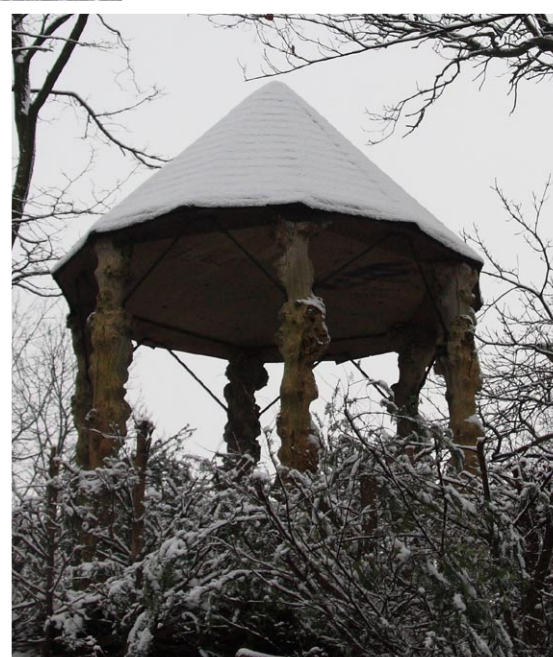
De ijskelder in het Solhof.